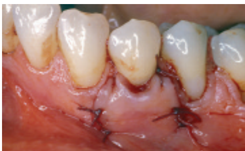
Colgajo suturado en el lugar.