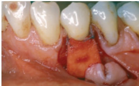
Membrana BioMend colocada sobre zona de defecto.