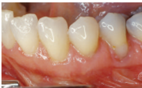
Seguimiento postoperatorio; se ha conseguido la cobertura deseada de la raíz.

Los resultados individuales pueden variar.