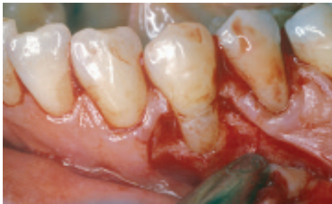
El sitio del defecto expuesto antes de la cirugía.

Riesgo de contaminación reducido Las plantillas estériles permiten el moldeado previo a su colocación; la membrana sólo se tiene que colocar en el sitio del defecto una vez, lo que reduce el riesgo de contaminación.